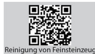
Reinigung von Feinsteinzeug

Video auch unter: www.orochemie.de/de/presse_videothek.php